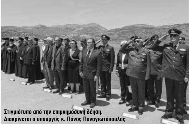
Στιγμιότυπο από την επιμνημόσυνη δέηση. Διακρίνεται ο υπουργός κ. Πάνος Παναγιωτόπουλος

Στην ομιλία του ο υπουργός Εθνικής Άμυνας, Πάνος Παναγιωτόπουλος , εξήρε την προσφορά του ηρωικού σμυναγού προς την πατρίδα και ανέφερε ότι « αυτό που συνέβη πριν επτά χρόνια στην Κάρπαθο ήταν το αποτέλεσμα μιας σειράς συνεχιζόμενων προκλήσεων που αντιμετωπίζει η φιλειρηνική χώρα μας από τους Τούρκους γείτονες ».