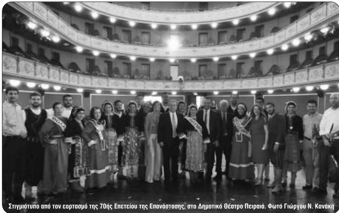
Στιγμιότυπο από τον εορτασμό της 70ής Επετείου της Επανάστασης, στο Δημοτικό Θέατρο Πειραιά.

Το ίδιο έκαναν και όλοι οι επίσημοι προσκεκλημένοι, ομιλητές καθηγητές, που χειροκροτήθηκαν από