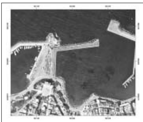
Πρόταση Γαρόνησου με εναλλακτική