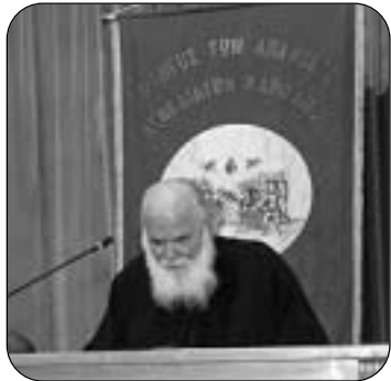
Ο Ομότιμος Καθηγητής Παν/μίου Αθηνών Γεώργιος Μεταλληνός