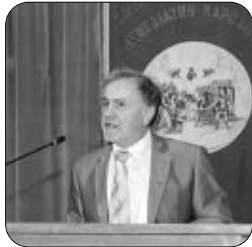
Ο Καθηγητής Παν/μίου Αθηνών Χαράλαμπος Μπαμπούνης