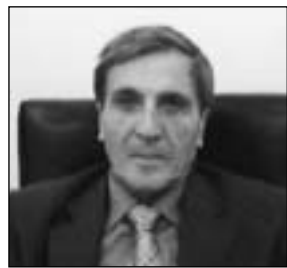
Γράφει ο Ν. ΚΑΝΑΚΗΣ Υποναύαρχος (Α.Σ.) ε.α.

ΤΟ 2005 προκηρύχθηκε από την Περιφέρεια ύστερα από αίτημα του Δήμου μελέτη επέκτασης του λιμανιού ανατολικά του Γαρόνησου. Παρότι είναι υποχρεωτικό να προτείνονται τρεις τουλάχιστον εναλλακτικές λύσεις, λόγω του των προτέρων δεσμευτικού προσδιορισμού της θέσης του έργου και οι τρεις εναλλακτικές λύσεις που πρότείνε ο κάθε μελετητής ήταν παραλλαγές της μιας και μόνο λύσης αυτής του «Γαρόνησου».