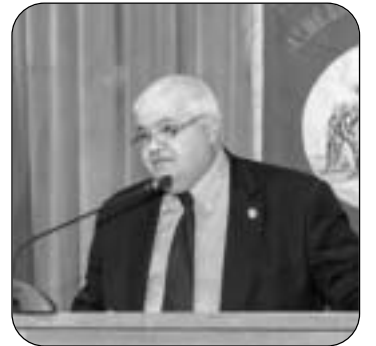
Ο Καθηγητής Παν/μίου Αθηνών Δημόσθνης Δασκαλάκης