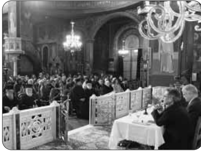
Στιγμιότυπο από την παρουσίαση του νέου βιβλίου του π. Καλλινίκου «Σχόλια επικαιρότητας» στον Ιερό Ναό Αγίου Βασιλείου στον Πειραιά

✓ Την Τετάρτη 5 Φεβρουαρίου, προσκεκλημένος του Σεβ. Μητροπολίτη Ρό-