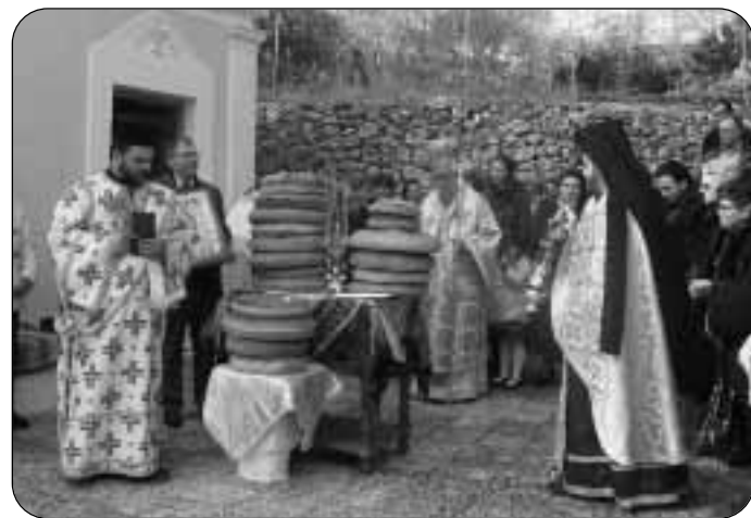
Στιγμιότυπο από το πανηγύρι του Πολιούχου Όθους, Αγ. Βλασίου, ιερουργούντος του Μητροπολίτου μας, κ.κ. Αμβροσίου