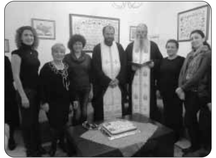
Στιγμιότυπο από την κοπή της βασιλόπιτας του Συλλόγου Κυριών & Δεσποινίδων στο «Σπίτι της Αγάπης»