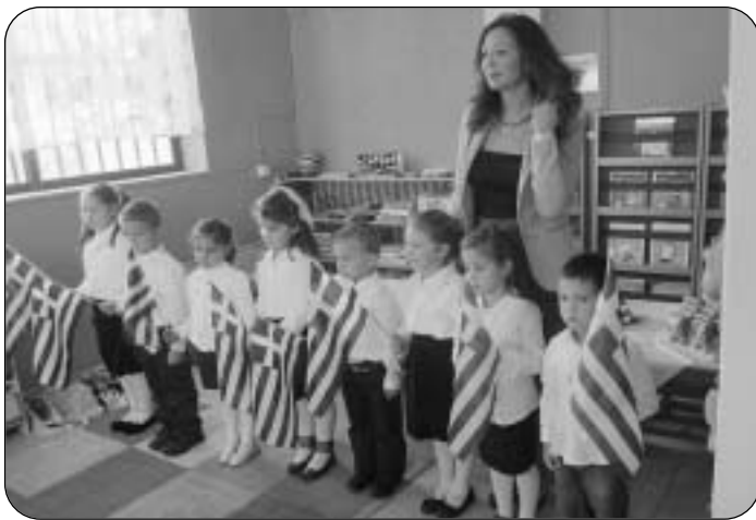
Οι μικροί μαθητές και μαθήτριες του Νηπιαγωγείου μας