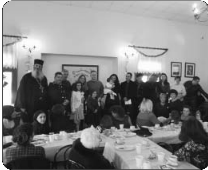
Από τη Χριστουγεννιάτικη εκδήλωση στο κατάμεστο Μέγαρο

— Την Κυριακή 15 Δεκεμβρίου, στο πρόγραμμα «Ενορία εν δράσει» προβλή-