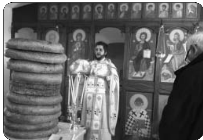
Ο εορτασμός στο εκκλησάκι του Αγίου Νικολάου