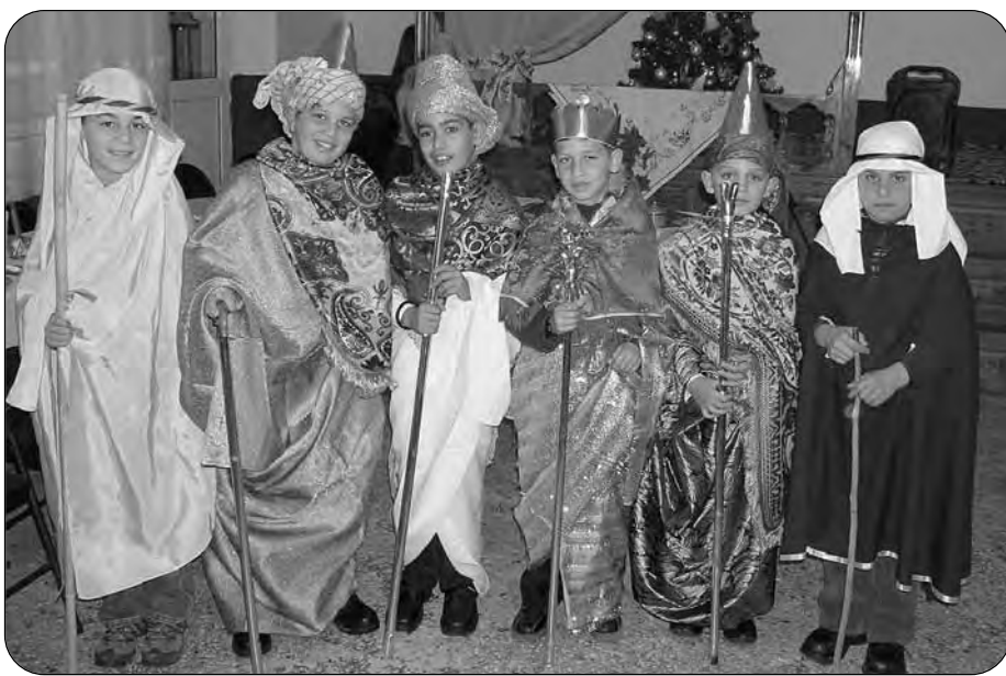
Στημιγνύποτα από το μικρό θεατρικό του Δημοτικού Σχολείου

Στη Παναγία τη Πλαγιά που 'ναι λειτουργηούμε κ' ευχές να ανταλλάξουμε όταν εκεί βρεθούμε. Η Παναγία η Πλαγιά που 'ναι προστάτιδά μας να βοηθήσει όλους μας να κούμει την υγεία μας. Ν'ανοίξουμε τα σπίτια μας που 'ναι κλειδωμένα ποταρικό να κούμουμε όπως τα περασμένα. Γεμίζοντα της στάμια μας νερό από τη Βία και μια αθάνατη μαζί για να 'κούμει υγεία. Ω Παναγία μου Πλαγιά κούμ και σύ το θάμα να ρθούμε τα παιδάκια σου όλα μαζί ανάμα. Κάτω απ'του δέντρου τα κλαδιά να σφικταγαλιστούμε σαν έρθουμε εις τη Βωλά