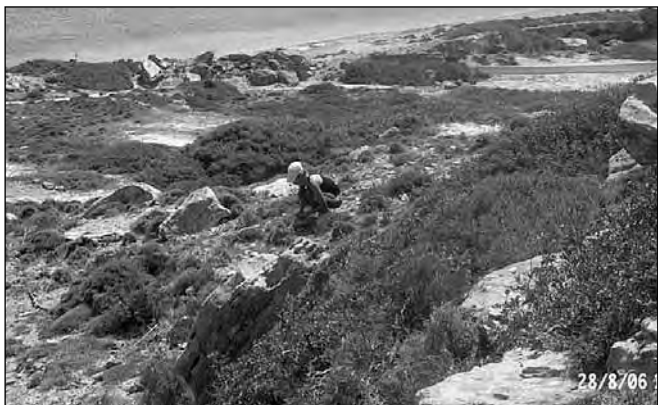
Μινωικός οικισμός στη Βαθά/Κόκκινη Στεφανιά, με φοιτήτρια επί το έργο

προδιαγεγραμμένη και η ανθρώπινη εγκατάσταση περιοριζόταν σχεδόν πάντα και ιδιαίτερα στη Μινωική εποχή σε πετρώδη μη αρώσιμα μέρη, που ήταν κατά κανόνα υπερυψωμένα (χαμηλοί λόφοι ή πεταλοειδείς ράχες) προκειμένου να εξασφαλίζεται στέρεη θεμελίωση, θέα-έλεγχος και ασφάλεια. Αυ-